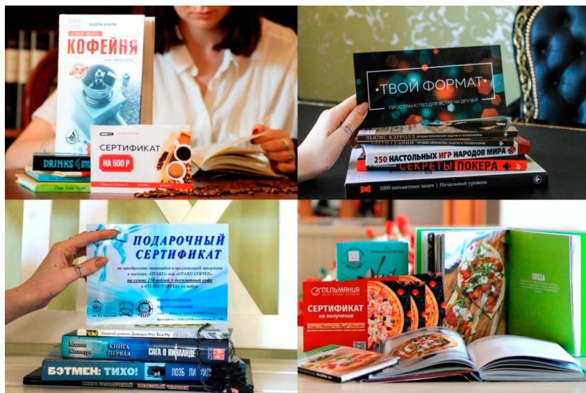
Рисунок 1. Фотографии для рекламы спонсоров

Для спонсоров важна заинтересованность в сотрудничестве. Поддерживая проекты ГБУ «ДРУНБ», наши партнёры получают официальную благодарность, возможность размещения логотипа на афишах мероприятий, а также рекламные публикации в социальных сетях с уникальными фотографиями. На таких фотографиях обычно присутствует продукт спонсора, например, сертификат на посещение или приобретение продукции, размещённый в интерьере библиотеки возле тематически подобранной литературы из фонда ( Рисунок 1 ). Также спонсорам можно предложить выступить на мероприятии с приветственным словом, распространить визитки или листовки среди участников мероприятия.