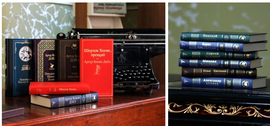
Рисунок 1. Фотографии книг, предоставленных Фондом

русскоязычного населения, представители Фонда заинтересованы в сохранении русского языка, популяризации чтения среди населения, поддержании интереса к русской классической литературе.