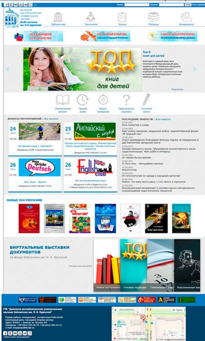
Рисунок 1. Вид главной страницы веб-сайта библиотеки (версия 2019 года)