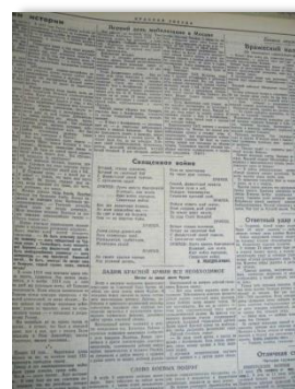
Фото на экране: газета «Красная Звезда» с текстом песни

В тот же день стихи со знаменитой первой строчкой «Вставай, страна огромная!» были опубликованы в газетах «Известия» и «Красная звезда» и с тех пор стали звучать по радио регулярно.