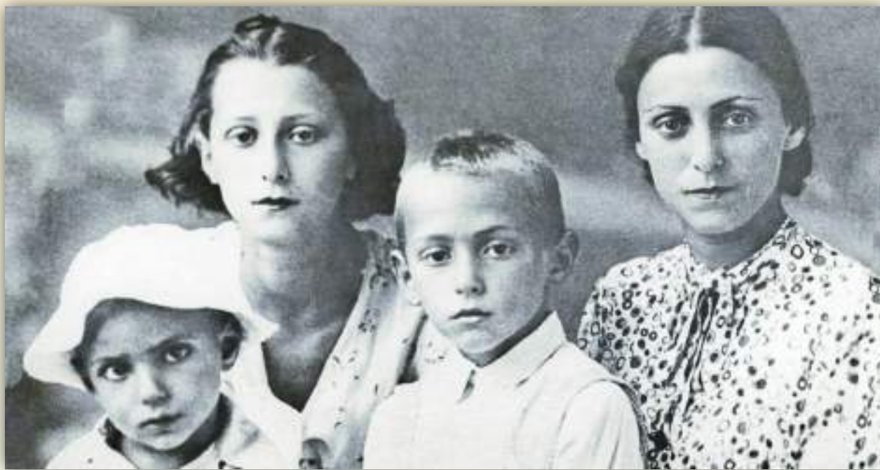
Майя Плисецкая с матерью Рахиль и братьями Александром и Азарием

«Сейчас я мучительно напрягаюсь, чтобы вспомнить, как получилось, что вечером в театре я внезапно оказалась совсем одна. Без мамы. С большим букетом крымских мимоз. <...> Спектакль заканчивается, поклоны, аплодисменты. А где мама? Ведь мы были вместе».