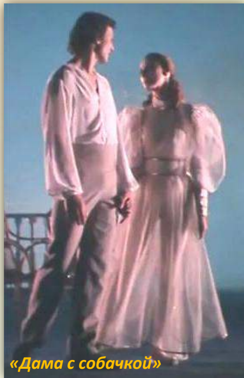
«Дама с собачкой»