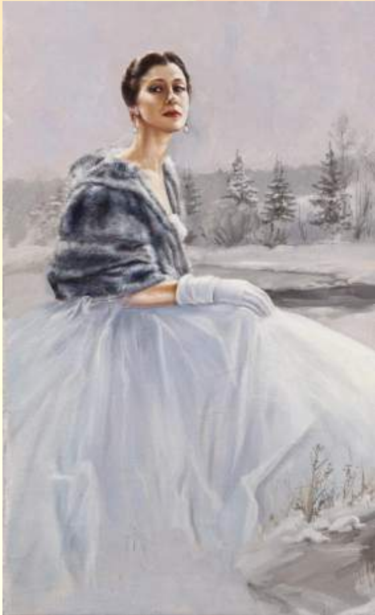
Портрет Майи Плисецкой. Художник Н. Сафронов

В её имени слышится плеск аплодисментов.