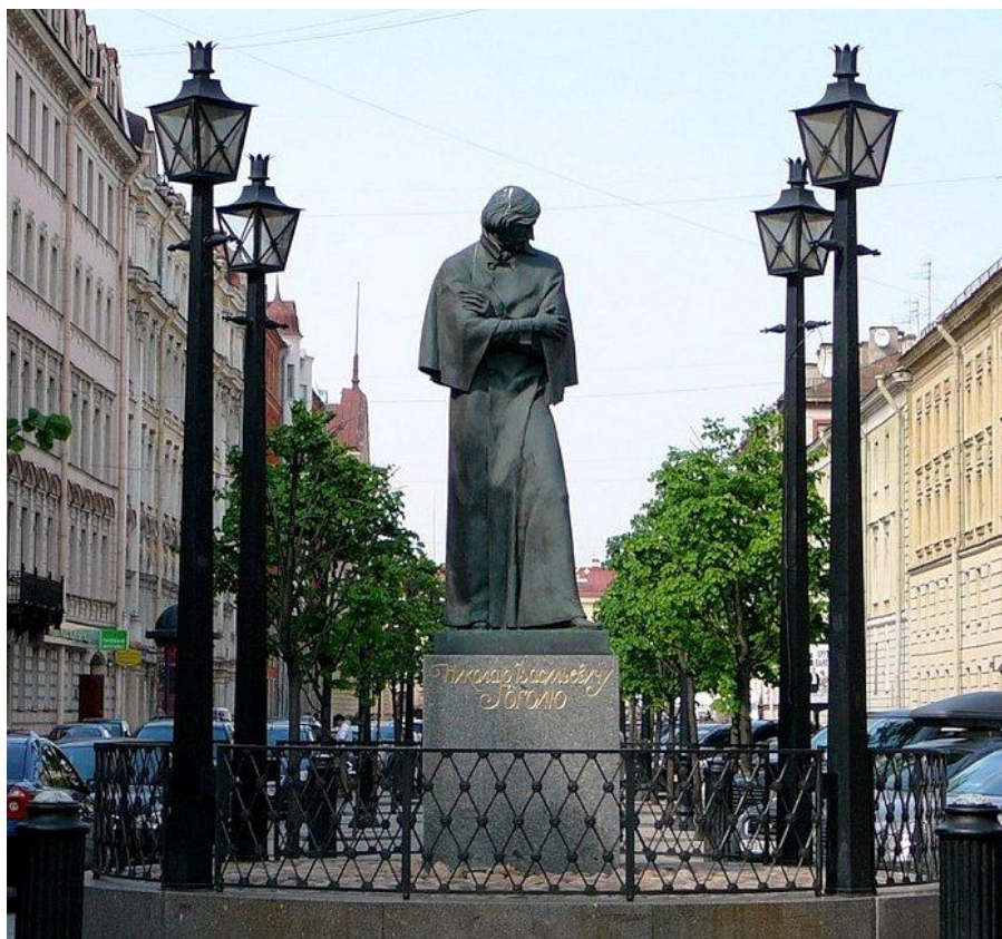
Памятник Гоголю в Санкт-Петербурге

Кулинарные пристрастия гениев: Гоголь [Электронный ресурс]. – Режим доступа: https://www.livelib.ru/articles/post/18486-kulinarnye-pristrastiya-geniev-gogol .