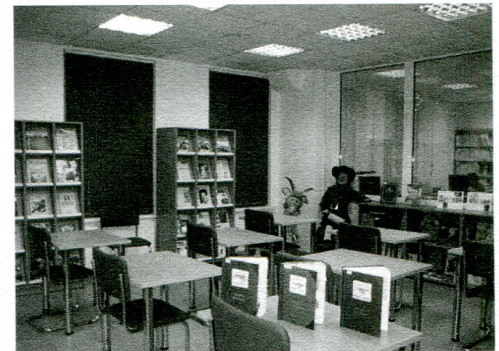
Зона работы с печатными материалами

А может быть, нам покажется привлекательным вывод японского архитектора Тойо Ито: «Архитектура электронной эпохи — это медиахранилище, в котором сольются воедино музей, га-