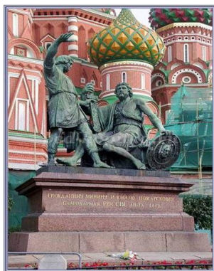
1. Памятник Минину и Пожарскому