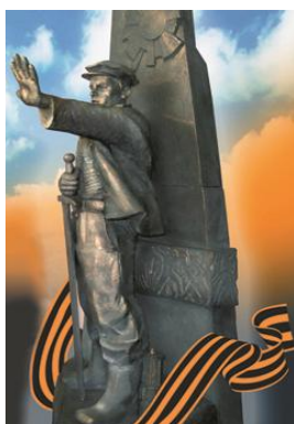
Макет памятника авт. В.Пискун

6 мая 2010 года на Одесской земле, у бывшей 412-й батареи, был торжественно открыт памятник мужеству и героизму шахтеров Донбасса, памятник воинам, отдавшим жизни «за други своя».